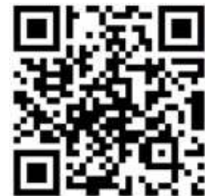
경희대 원우회 카톡